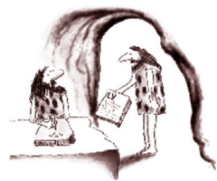
Wieder so'n LV

Gern nehmen wir auch an der Roadshow mit _____ Teilnehmern teil.