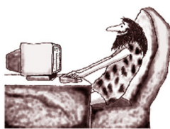
schön, dass es Dich gibt!